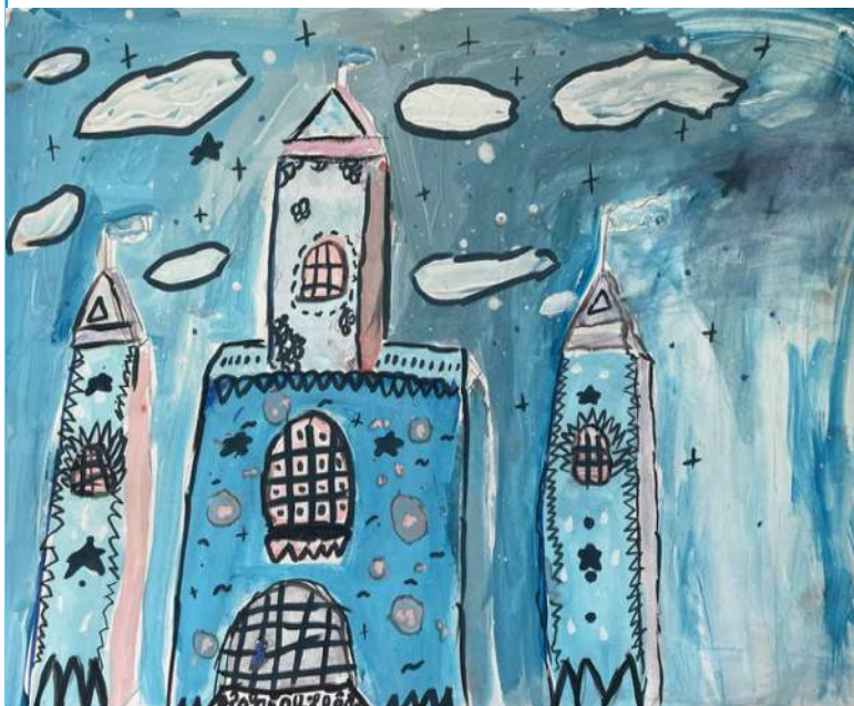
Соловьева Юля. 2 класс