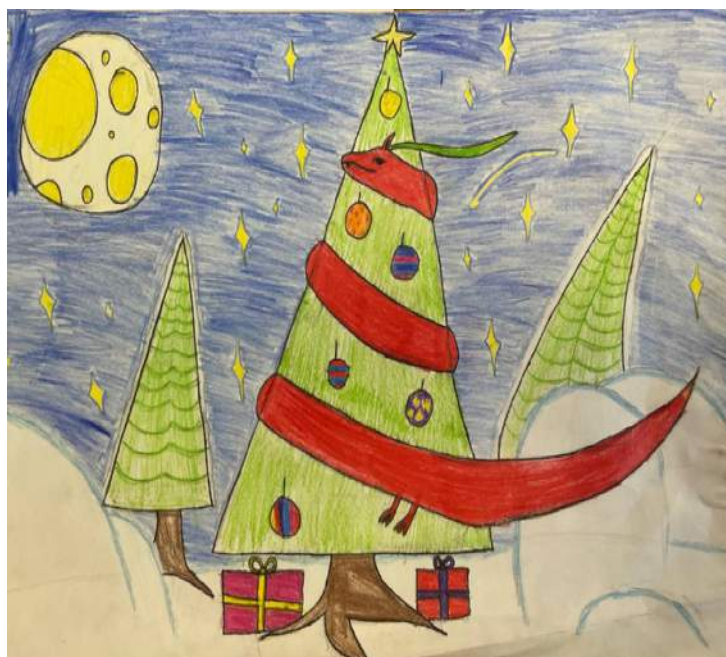
Рыбасова Наталья. 5 класс