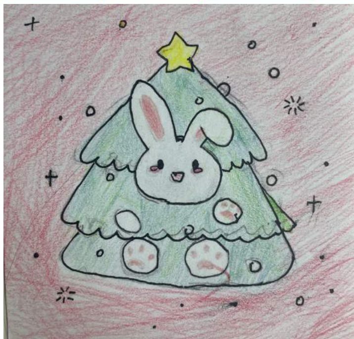
Шпак Влада. 6 класс