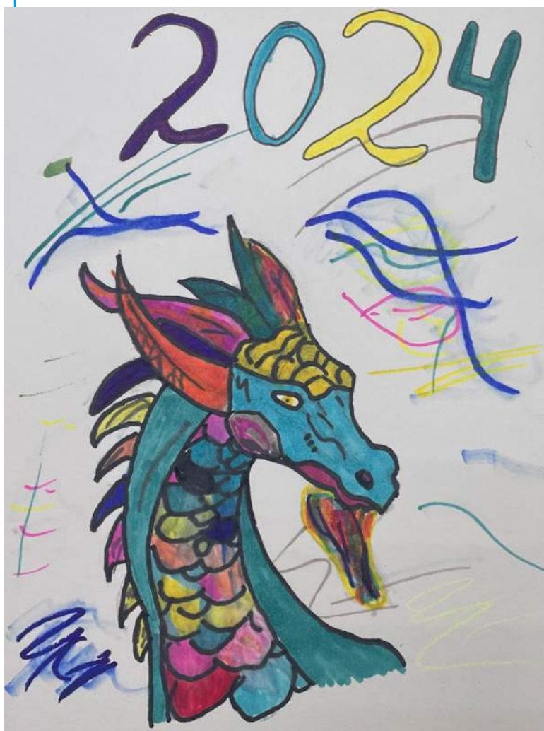
Пеньковская Софья. 6 класс