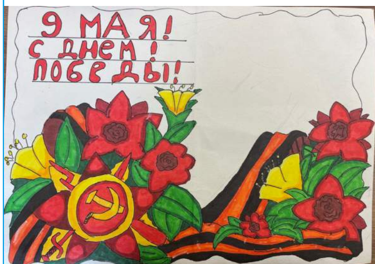
Коротких Нелли. 3 класс