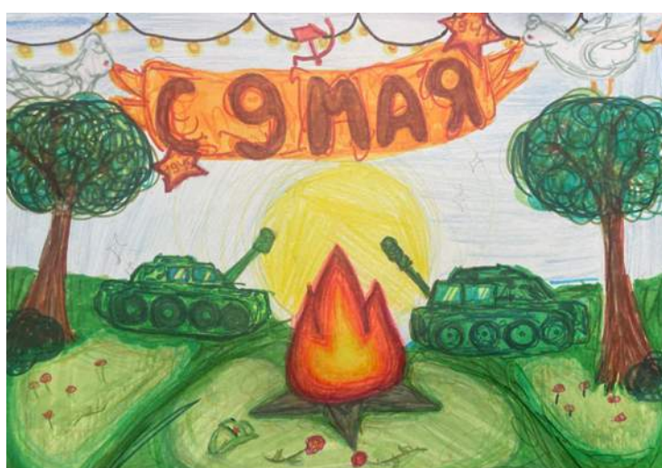
Флек Оливия. 4 класс