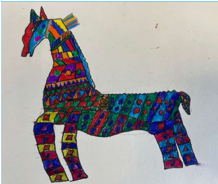
Федосеенко Ярослав. 5 класс