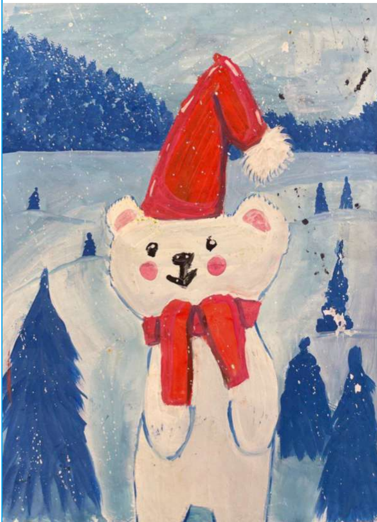
Бурчиян Тимур. 4 класс