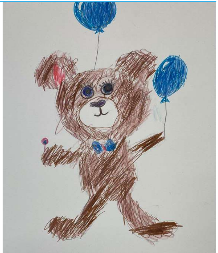
Долгалев Всеволод. 1 класс