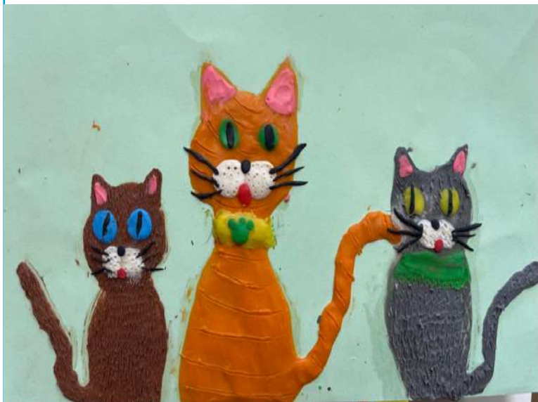
Дудченко Данелия. 4 класс